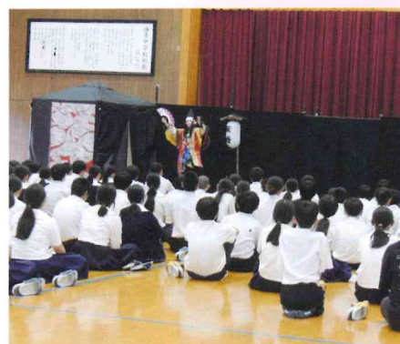
唐津市立海青中学校にて

「神楽」 6月9日 江北町立江北中学校 6月11日 県立太良高等学校 6月12日 県立うれしの特別支援学校 6月13日 唐津市立海青中学校 6月16日 伊万里市立南波多郷学館 6月18日 鹿島市立東部中学校 6月19日 太良町立大浦中学校 6月20日 佐賀市立三瀬中学校