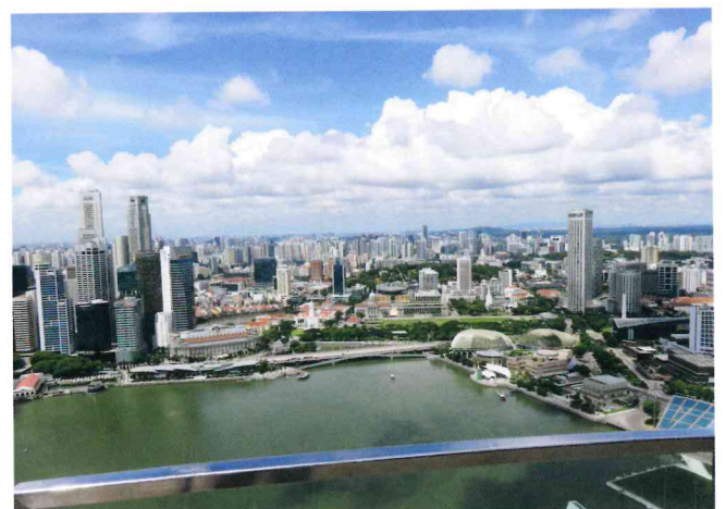
展望フロアからのシンガポールの様子

さすがシンガポール。頑張り頑張り続けている国を目の当たりに見、老いに向かっている私は喝を入れられた。