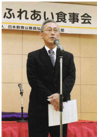
開会のあいさつの様子です。

11月16日(金)午前11時45分から、今年度で3回目の開催となります教弘友の会ふれあい食事会を、グランデはがくれにて、教弘友の会会員とご家族やご友人の方々の計51名で開催いたしました。昨年度に引き続いての参加者もいらっしゃいましたが、8割以上が新たに参加された方々でした。