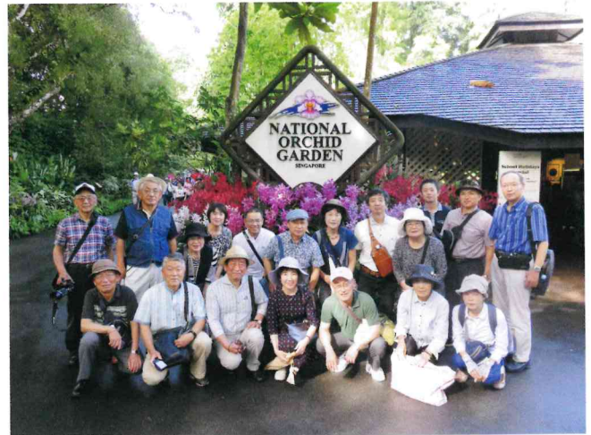
世界遺産の蘭園にて

ンズ・バイ・ザ・ベイ(巨大ガラスドーム植物園)。作りに作ったものだ。世界一の人造瀧しかり、この国の観光に力を入れているのをしかと見せつけられた。