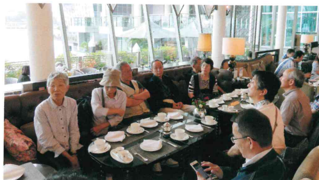
優雅なアフタヌーンティー

まず、来年私の作品を出品予定の「アートオブツモウロウ」の会場を視察し、「ナショナルギャラリー」を見学して、見応えある素晴らしい作品の数々に目を奪われました。